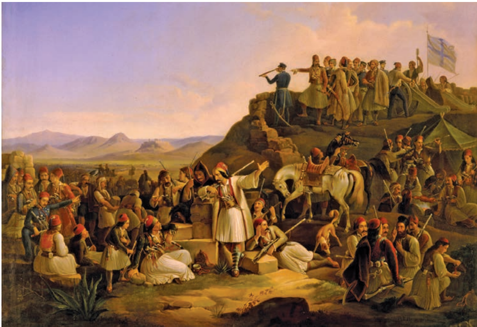
Θεόδωρος Βρυζάκης, Το στρατόπεδο του Καραϊσκάκη

Σολωμός, Δ. 1999. «Ύμνος εις την Ελευθερίαν», απόσπασμα· στο Ποιήματα . Αθήνα: Ίκαρος