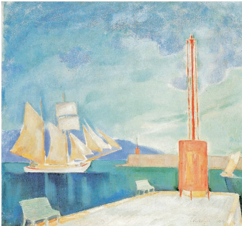
Κωνσταντίνος Παρθένης, Το λιμάνι της Καλαμάτας