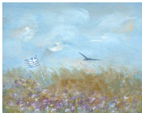
«25 Μάρτη», Σπύρος Κουρσάρης