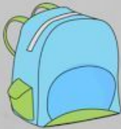
un sac à dos