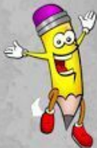
un crayon de couleur